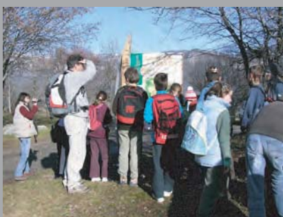
11 janvier 2008 : inauguration du sentier avec la classe de CM2 de Curienne. (retrouvez leurs impressions sur : http://curienne.com/ecole/ )

Les sept haltes : L'abeille, source de biodiversité; La Chapelle ; Les pelouses sèches; les paysages et la biodiversité; Le paysage agricole; la pelouse pâturée et les lisières forestières.