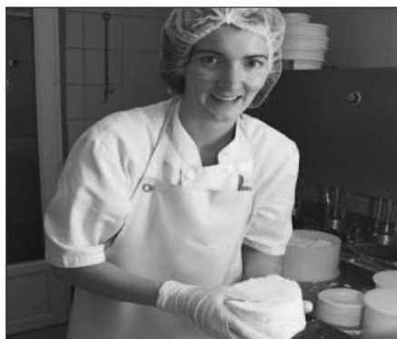
Ci-dessous, fabrication du Saint-Nectaire AOP.

digne de ce nom. Avec une évolution programmée du cahier des charges qui s'oriente vers un passage au tout-foin, la filière est directement intéressée par la problématique de la biodiversité dans les prairies de la zone d'appellation. ■