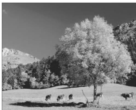
Ci-dessus, pâturages d'automne Ci-dessous, traite mobile dans les Bauges.

Imbriquées dans l'écosystème montagnard (bocage, torrents, lisières, vergers, alpages), elles abritent une