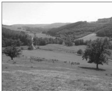
Ci-dessus, prairies sèches du PNR Morvan. Ci-dessous, patrimoine bâti du PNR Morvan.

P lus connu pour sa production de sapins de Noël (1/4 de la production française), le Morvan n'en possède pas moins une agriculture de moyenne montagne importante et essentiellement herbagère. Le maintien des prairies dans un bon état de conservation sur le plan environnemental est donc dépendant de l'entretien agricole. Le Parc passe ainsi des contrats prairies fleuries avec les agriculteurs depuis 2008. Les enjeux sont de maintenir