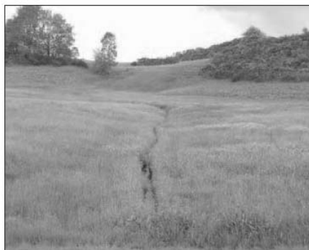
Ci-dessus, vallon humide du PNR des Volcans d'Auvergne.

Les exploitants agricoles représentent 12 % de la population active sur le territoire du Parc des Volcans qui compte près de 3 000 exploitations. Les herbages, riches et diversifiés, sont imbriqués dans les éléments paysagers. Près de 285 000 hectares sont en herbe (95 % de la SAU), ce qui fait du Parc des Volcans un véritable « territoire d'herbe et d'élevage ». L'organisation d'un concours des prairies fleuries sur le territoire va mettre en avant ces spécificités qui forgent l'identité de ce territoire, le fromage AOP Saint-Nectaire en particulier, tout droit issu des zones volcaniques. Principal fromage AOP fermier de France (250 producteurs, 6300 tonnes), le Saint-Nectaire s'emploie à concilier modernité et respect « des usages locaux, loyaux et constants » régissant toute appellation