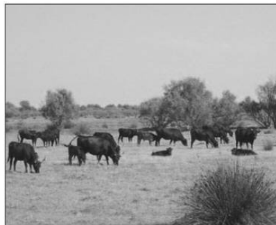
Paysage du delta du Rhône.

des partenaires, tels que la Chambre d'agriculture, les associations d'éleveurs, les scientifiques de la Tour du Valat, etc... ■