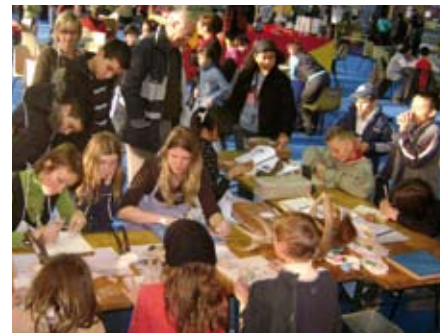
UGINE : Stand du Parc animé autour de la création artistique et de la faune des Bauges lors du salon du jeu et du jouet les 8 et 9 décembre.