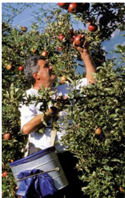
La collecte des fruits en Combe de Savoie