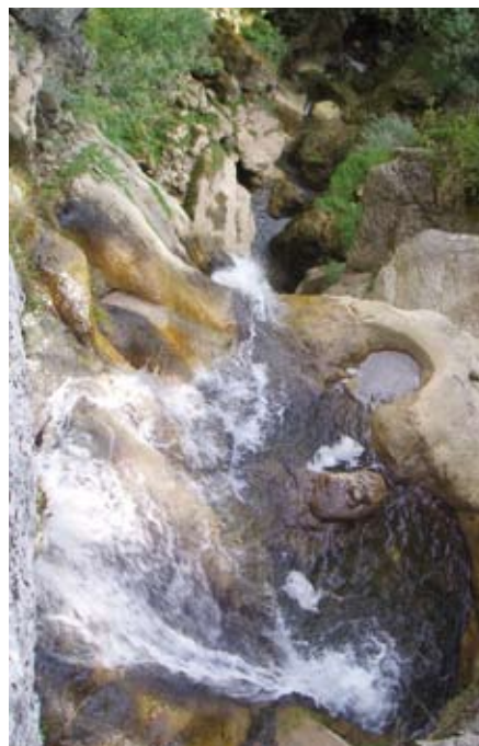
Un très beau canyon, très diversifié !