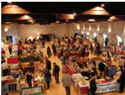
CHAMBERY : Participation au traditionnel marché de Noël en présence de nombreux producteurs et artisans au Manège les 20 et 21 décembre.