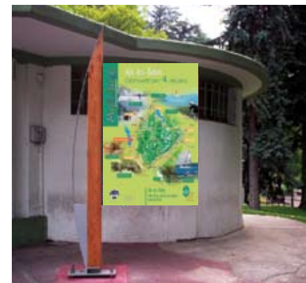
AIX-LES-BAINS : La ville affiche son statut de ville porte à travers un mobilier urbain implanté sur le parvis de la gare, à la piscine et aux Thermes.