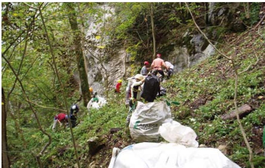
Les bénévoles en action pour nettoyer les abords du canyon.