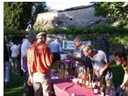
ALBERTVILLE : Valorisation des produits du terroir lors d'un pique-nique géant de 180 personnes le 31 juillet à l'occasion du 10 e anniversaire du festival « les rencontres musicales »