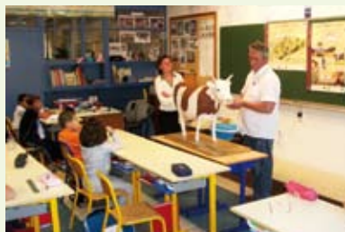
Animations pédagogiques autour du goût dans les écoles primaires des villes portes en partenariat avec le réseau « la clef des champs ».

La valorisation des produits du terroir dans la restauration collective a été engagée avec tous les partenaires du Parc et les responsables des restaurants scolaires des villes.