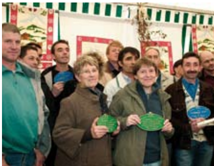
RUMILLY : Remise des prix du concours « prairies fleuries » lors de la foire d'automne les 19 et 20 octobre.

Éditions Rustica - Format : 240 x 280 / 244 pages - 29,50 € - en vente au Parc et en librairies