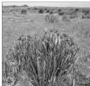
Prairie de la zone méditerranéenne, PNR de Camargue (les Amis des marais du Viguirat).