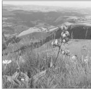
Prairies de moyenne montagne (PNR des Volcans d'Auvergne).