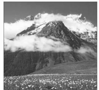
Prairies de haute montagne, PN des Ecrins (Marc Corail).