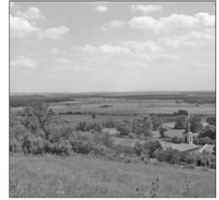
Prairies maigres en Lorraine (PNR de Lorraine).