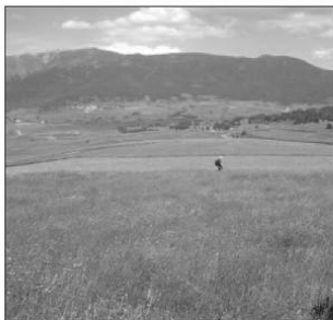
Prairie du massif des Pyrénées (PNR des Pyrénées Catalanes)