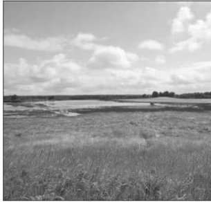
Prairie de zone humide atlantique de plaine (PNR de Brenne).

Le concours agricole national des prairies fleuries engage 18 territoires participants, dont cinq parcs nationaux et 13 parcs naturels régionaux, représentatifs des contextes pédo-climatiques rencontrés en France.