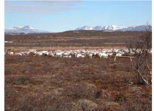
Troupeau de rennes au Finnmark, Norvège

Pour cela, nous avons utilisé le fait que les troupeaux sont gérés à des densités très différentes au sein de districts voisins, donc semblables quant à leur géologie ou géographie. Nous avons estimé la biomasse des plantes – en les regroupant suivant leur appétance pour les rennes et leur rôle pour l'écosystème. Certaines espèces peuvent ainsi avoir un impact négatif en terme de productivité, comme la Camarine noire ( Empetrum hermaphroditum ) connue pour ses propriétés allelopathiques, et évitée par les rennes. En plus des plantes, nous nous sommes aussi intéressés aux autres herbivores, en relevant toutes les crottes de campagnols, lemmings, lièvres, et lagopèdes (et des rennes !), sur un ensemble de points d'échantillonnage choisis aléatoirement (méthode d'échantillonnage de type aléatoire stratifié). Ceci nous a conduit à emprunter les garde-côtes ou des hydravions pour avoir accès à certains points d'échantillonnage – à pied, il nous aurait fallu parfois