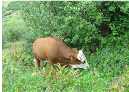
Une génisse de race abondance en lisière

Au cœur de la Réserve Nationale de Chasse et de Faune Sauvage, sur l'alpage d'Armenaz, la suppression des activités pastorales pendant 50 ans a laissé le champ libre aux dynamiques de végétation. L'aulne vert a bénéficié simultanément de l'absence de pâturage par les ruminants domestiques et de l'arrêt de la coupe du bois de chauffe pour les chalets et la fabrication du fromage en alpage. Cet arbuste, en colonisant à la fois par drageons et par semis, finit par former d'épais taillis (voir Herbivorie Info n°1). À ses côtés, un cortège d'arbrisseaux, genévrier, rhododendron ou myrtille gagne également par plaques les pelouses anciennement pâturées. C'est pour limiter ces dynamiques et restaurer ainsi les habitats pour la faune sauvage que des génisses, futures vaches laitières, remontent tous les étés sur l'alpage depuis l'été 2003.