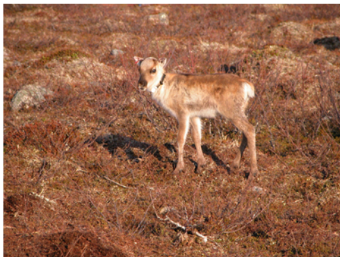
Un faon de renne marqué

Depuis une trentaine d'années, les effectifs des troupeaux de rennes du nord de la Norvège ont fortement augmenté. La raison principale en est la mécanisation – motos des neiges en hiver, et squads en été. Cette forte augmentation de la densité de rennes s'est traduite par une diminution de la production de viande – par exemple un poids des