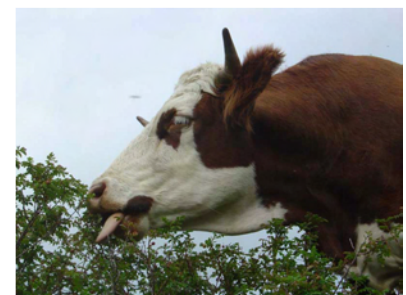
Bouchée gourmande sur un églantier

Cette reconquête pastorale a donc été une grande réussite du point de vue de l'alimentation du troupeau. Il est vrai que le troupeau avait déjà une assez bonne expérience de ces milieux, et que les éleveurs ont consacré du temps pour adapter leur conduite. Après 5 années de pâturage, il s'agit également aujourd'hui de voir si les génisses parviennent à infléchir les dynamiques d'aulnes verts envahissants. Les premiers résultats sont assez encourageants. Lorsque l'on décide de travailler avec les animaux, l'ouverture des milieux n'est bien sûr pas aussi rapide et spectaculaire qu'avec les engins mécaniques, mais elle est souvent bien plus pérenne