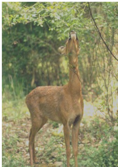
Chevreuil en action